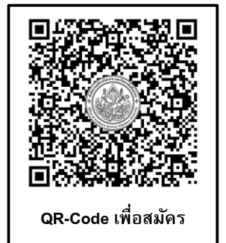
QR-Code เพื่อสมัคร

หมายเหตุ กรณีผู้เข้ารับการศึกษาจะดำเนินการชำระเงินค่าที่พักและค่าเดินทางล่วงหน้า ต้องได้รับการยืนยันดำเนินการจัดฝึกอบรมจากเจ้าหน้าที่แล้วเท่านั้น หากไม่ได้รับการยืนยันจากเจ้าหน้าที่ถือว่าไม่มีการดำเนินการจัดฝึกอบรมในหลักสูตรนั้น ผู้เข้ารับการศึกษาจะไม่สามารถขอรับเงินค่าที่พักและค่าเดินทางคืนจากทางมหาวิทยาลัยได้